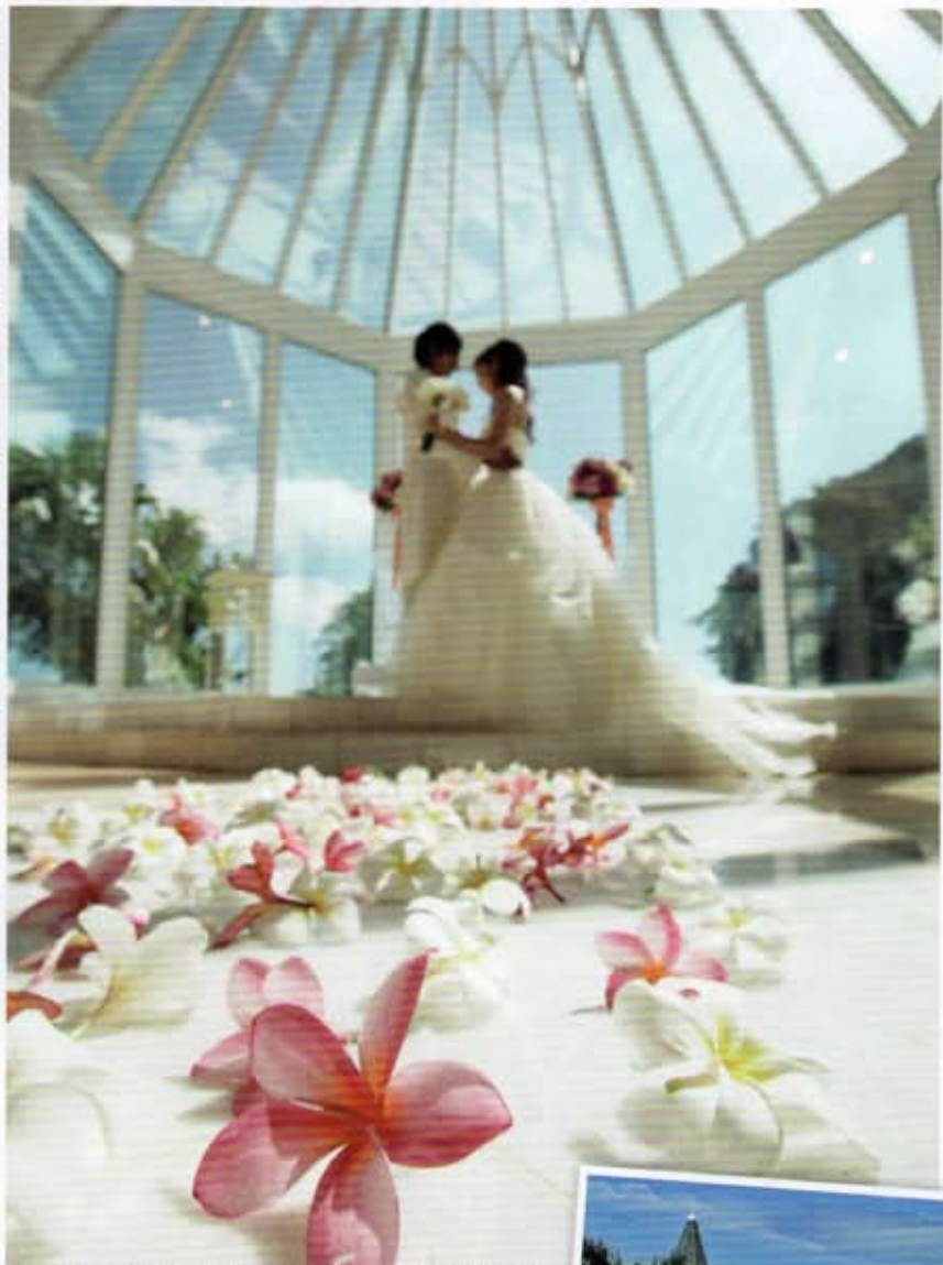
在海天一色的美麗環境下互相交換戒指，接受神父的祝福，此情此刻定令人永世難忘。

YourOverseasWedding 電話：8102 2243 網址：www.youroverseaswedding.com 地址：尖東麼地道63號好時中心268室