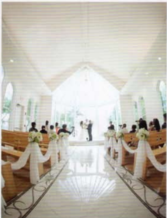
簡約純潔的白色佈置，加上親朋好友臉上的恩喜笑容、感動的眼淚送出濃濃的祝福。

教堂可容納人數：50人 無法舉行婚禮日：12月下旬至1月上旬 行禮紅地毯長度：12米／大理石 演奏音樂：電子管風琴 交通：由威基基到教堂車程約40分鐘。