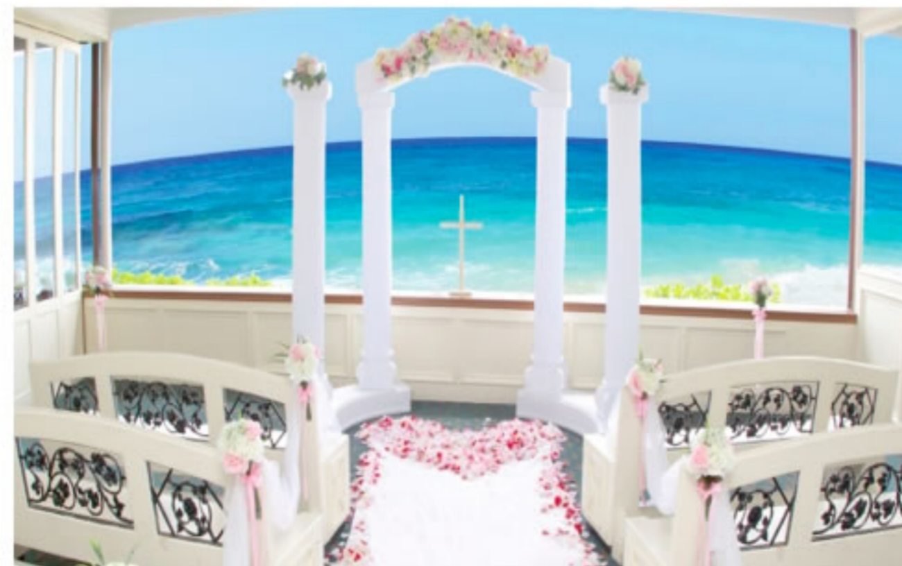
被白沙灘環抱的「海之教會」

夏威夷位於美國太平洋中心，擁有四周環海的漂亮沙灘，她的陽光與海灘更是世界聞名的，每月平均約有300對新人於美麗島上舉行婚禮。