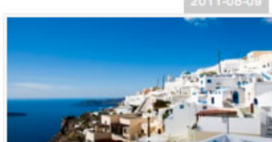
七大「愛之城」，你去過幾個?