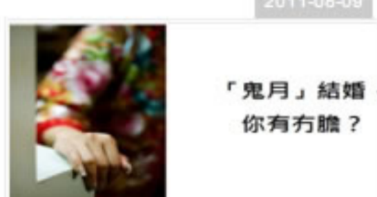
「鬼月」結婚 你有冇膽?