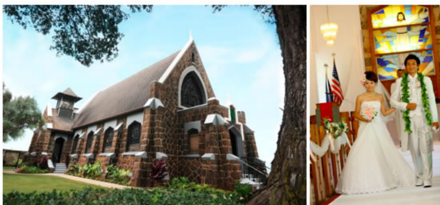
精緻浪漫童話式的「特色教堂」