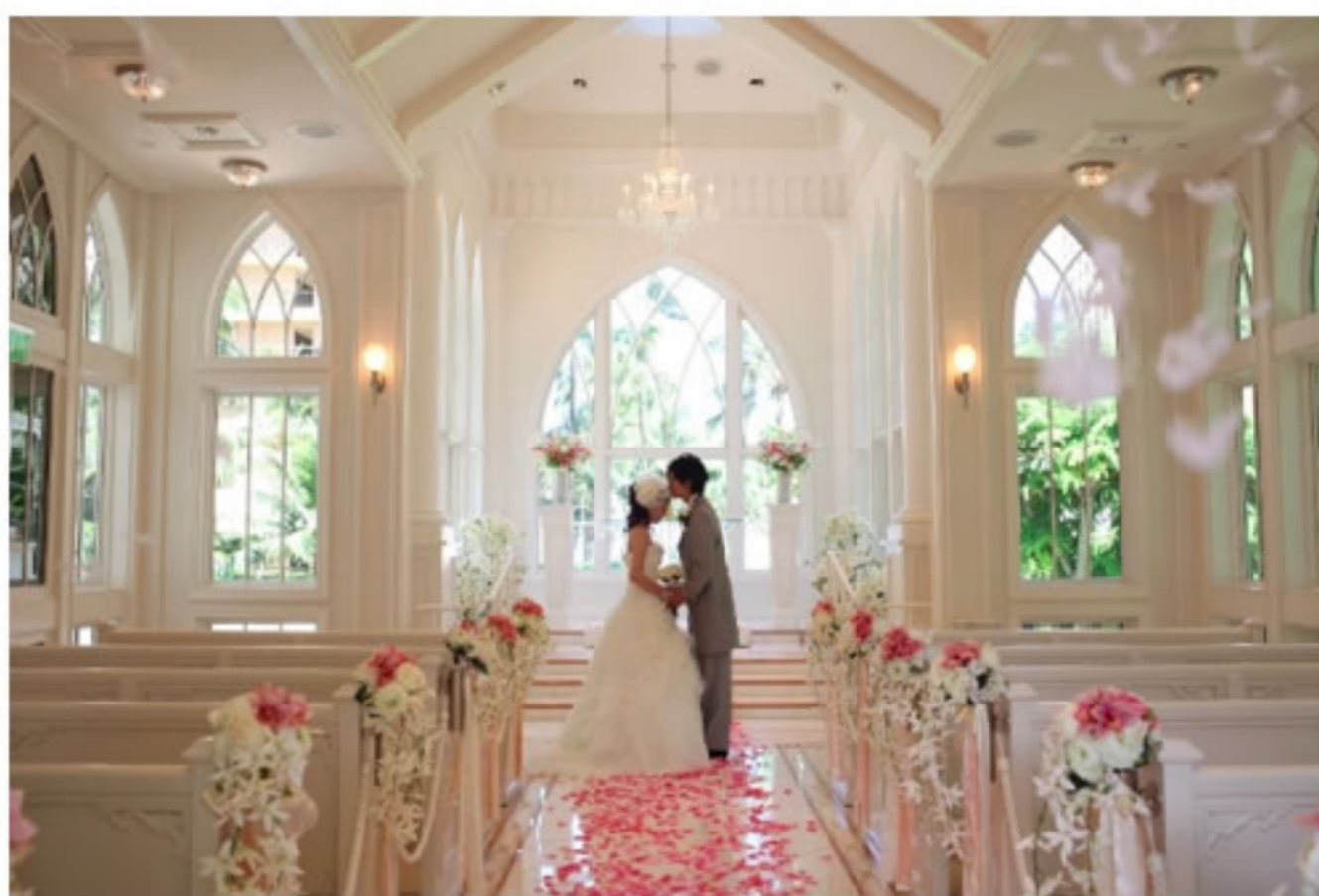
置身美麗綠洲的「海洋教堂」