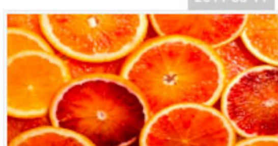
10元護膚偏方 健康又慳錢