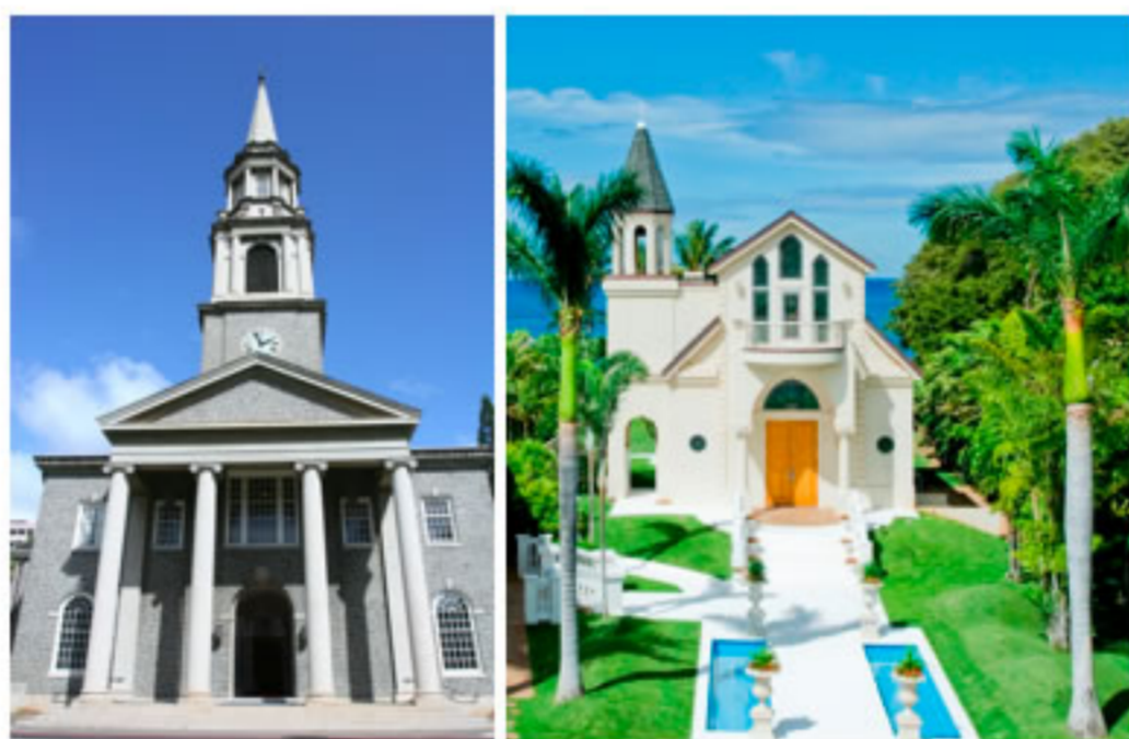
擁有瑰麗建築的「CUC 大教堂」 如童話城堡般的「水晶教堂」